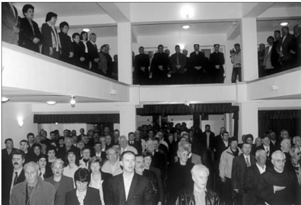
Župna dvorana u Kruševu sa slušateljstvom za vrijeme predstavljanja knjige stradalnika.

Moj prvi susjed stradao je na Križnom putu. Bio je oženjen i sa ženom je živio samo 4 mjeseca. Žena mu je ostala trudna. Rodila je kćerku. Ova se kasnije udala i rodila je 5 djece. Majka se nije udavala. Ostala je do