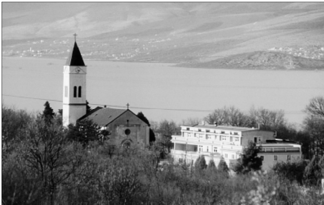
Pogled na župnu crkvu i župnu kuću, u pozadini Blato prepuno vode.

Prvih dana, avnojske Jugoslavije, pa sve do početka pedesetih godina Kruševom su hodali mnogi križari. Zbog pomaganja križarima, 41 Kruševljanin je završio u zatvoru s višegodišnjom osudom. Nekoliko ih je bilo u prvim presudama osuđeno na smrtnu kaznu.