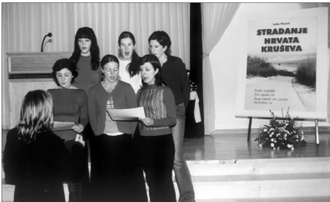
Zbor mladih "Kamenjak" u nastupu na predavljanju knjige.

O stradavanju Hrvata i Katolika za vrijeme duge turske vladavine, ostalo je u usmenoj predaji i nekoliko slučajeva - navodi pisac. Uglavnom su to bile pljačke imovine, sukobi i dočekivanja u klancima, obećaćenje