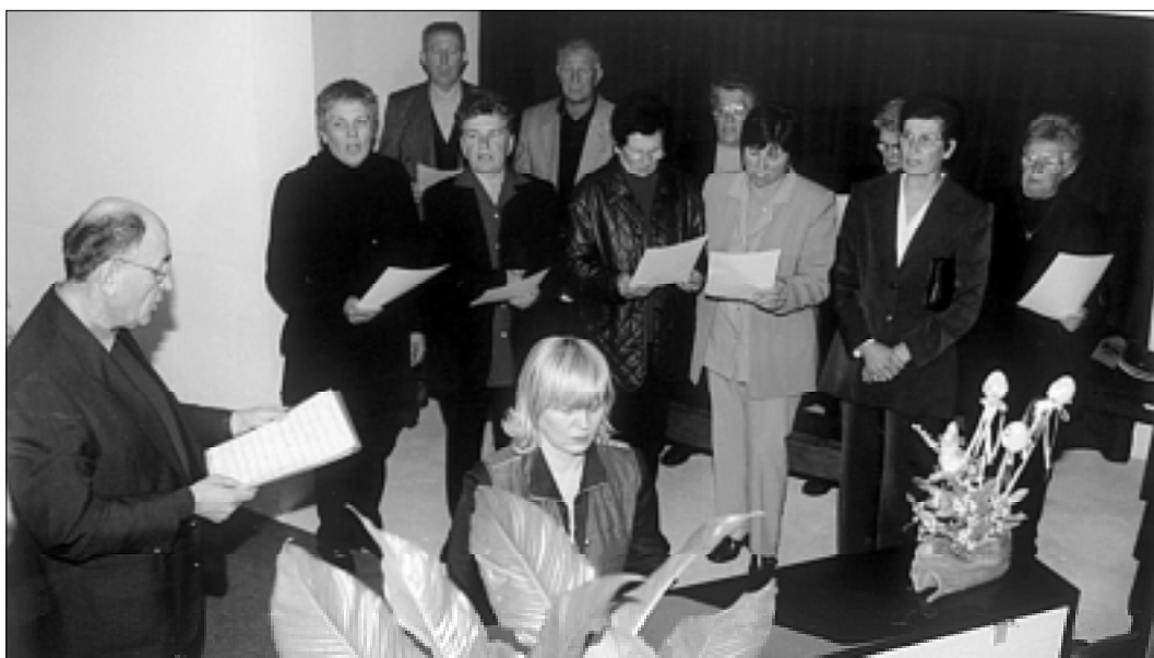
Pjevači Velikog zbora "Kamenjak" pjevali su "Dođi da vidiš".

"Sine nikome se klanjat nemoj, doli Bogu svom"