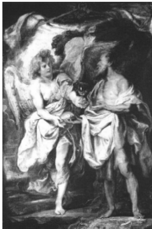
Anđeo Gospodnji hrani proroka Iliju.

Je li Ilija zaštitnik katolika u Bosni i Hercegovini? Zna se govoriti da prorok Ilija nije nikada bio proglašen zaštitnikom katolika BiH. I nije! Ilija je proglašen zaštitnikom bosanskog kraljevstva. Zna se čuti i danas tvrdnja: kraljevstva bosanskoga nema pa nije ni bitno naglašavati Iliju kao zaštitnika. Ali je povijest, i ne pitajući, štošta učinila svoje. Povremeno je Ilijin zagovor s onog kraljevskog prešao na narod. Uz kralja i kraljevsku lozu i narod je