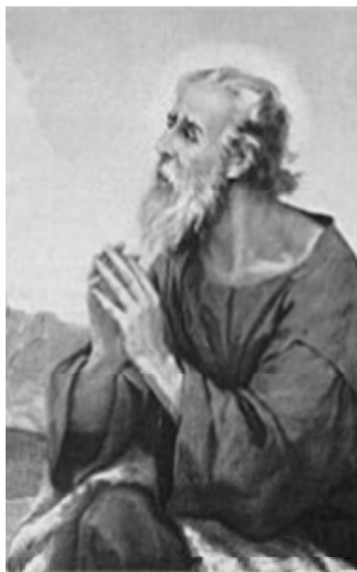
Prorok Ilija moli!

Kako pred Ilijom moliti? Apostol Jakov u svojoj poslanici Iliju stavlja kao uzor u molitvi te kaže: “Mnogo može molitva pravednika ako je žarka. Ilija je bio čovjek koji je patio kao i mi; usrdno je molio da ne bude kiše; i nije pala na zemlju tri godine i