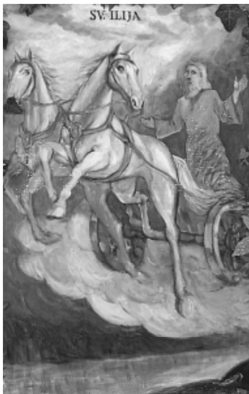
Stolac, Uznesenje proroka Ilije na nebo.

Svetkovine i blagdani: Iza dana posvećenih Bogu po značenju i slavljenju slijede