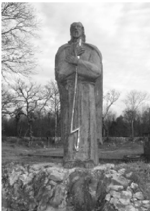
Veljaci, kip proroka Ilije.

Poruka: Bilo bi dobro da se dobro prouči život ovoga čovjeka. Njegov veliki žar s kojim je izgarao za Boga bilo bi dobro i danas slijediti. Ilija je svojim zalaganjem spašavao narod od zabluda i idolopoklonstava. Narod je u njegovo vrijeme bio duboko zašao u stranu. Smjelo i odvažno Ilija je pokazivao smjer kojim putem treba ići. Ilija je bio putokaz. Davno je rođen, davno živio, davno tjelesno umro, ali njegovo djelo i danas svijetli kao primjer. Ilija je prorok koji i danas privlači i osvaja.