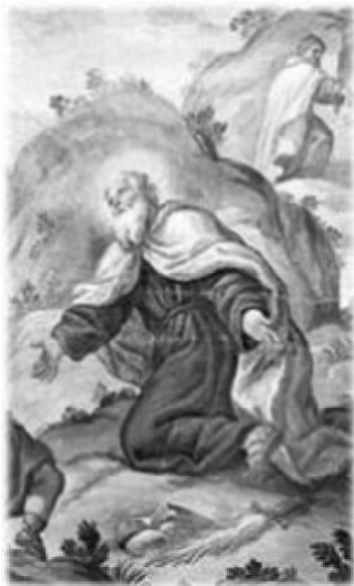
Prorok Ilija u molitvi.

Nakon rečenoga kako ne reći da je Ilija bio molitva, njegov život je molitva od onoga časa kad se on pojavio u javnosti, kada je izišao iz tajnosti, iz Tišbe Gileadske, od tada je Ilijin život postao molitva i žrtva za Boga, za Božju stvar, za čovjeka i čovjekov siguran životni tijek.